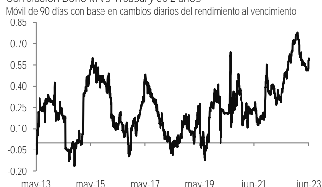
Correlación Bono M vs Treasury de 2 años